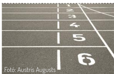
Fotó: Austris Augusts