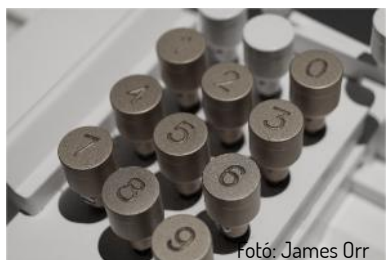
Fotó: James Orr