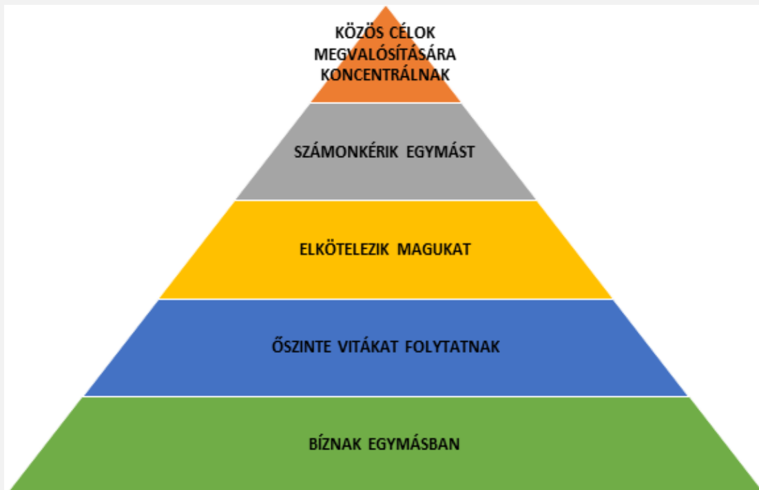
LENCIONI MODELL – SIKERES CSAPATOK